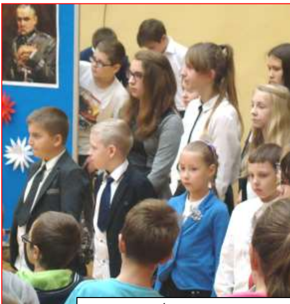
Akademia na Święto Niepodległości