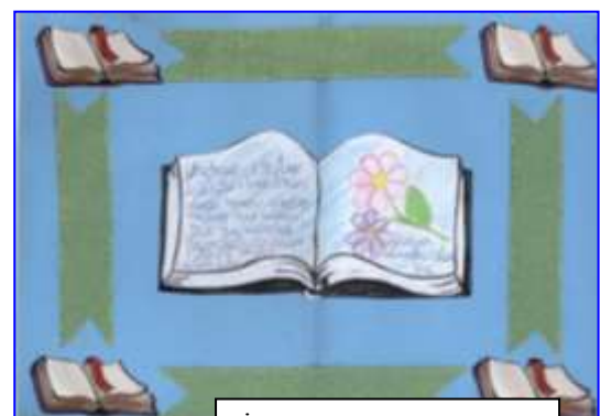
Życzenia dla biblioteki