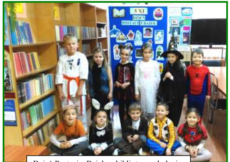
Dzień Postaci z Bajek w bibliotece szkolnej